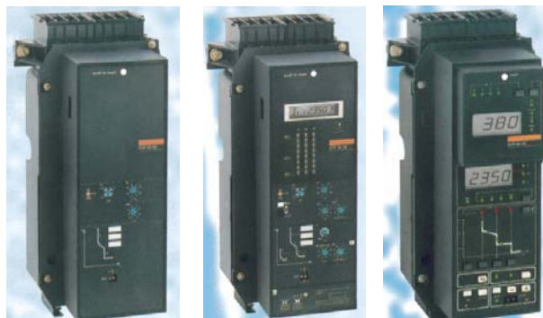
Programador para las unidades de protección ST y STR de interruptores Masterpact marco M de la marca Merlin Gerin de Schneider Electric.