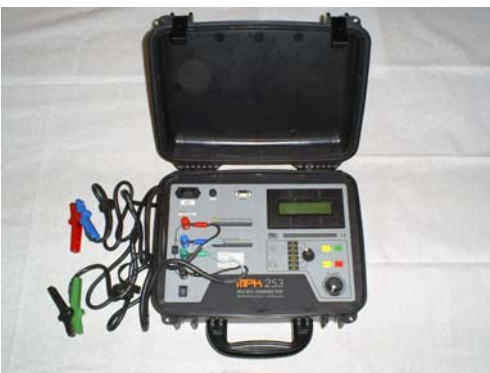
Ducter para pruebas de resistencia de Contactos.