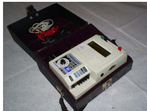
Megger para resistencia de Aislamiento.