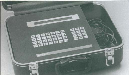
Maleta de pruebas para las unidades de protección SB-TL de interruptores Siemens.